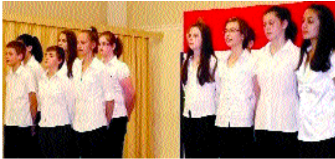
Nyelvünkől, kultúránkól meríthetünk erőt a nemzet megújulásához. Ez volt a mottója a 7. osztályosok műsorának.

Magyar Monarchia tűnt el a térképről, hanem Magyarország elvesztette területe jelentős részét, lakossága pedig, mintegy 10 millió fővel lett kevesebb. Trianon emléknapján országsszerte megemlékezéseket tartottak.