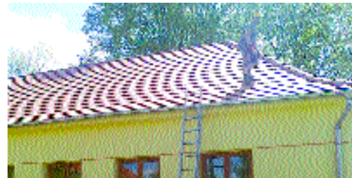
Folyik a munka