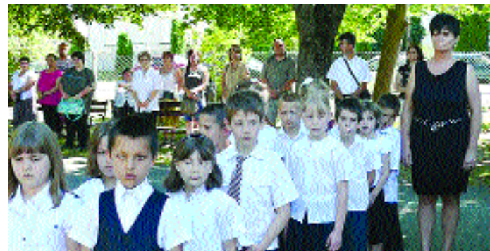
A várva-várt tanévzáró