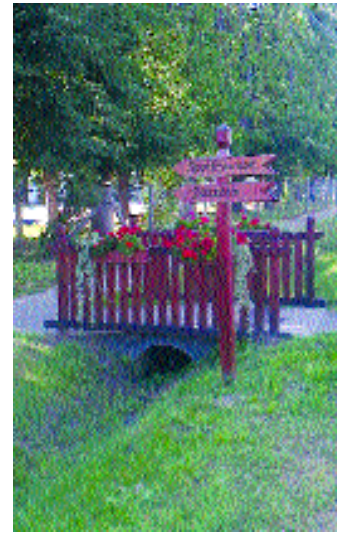
Szépítjük a falu közterületeit