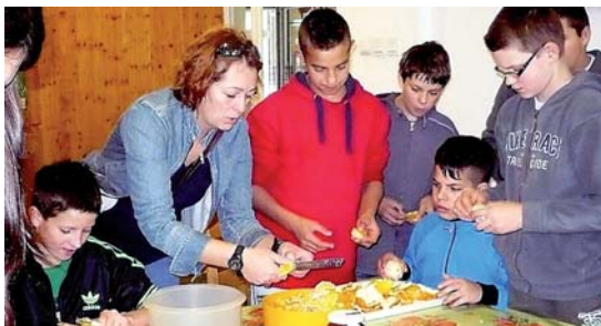
A produktum attól lett igazán finom, hogy az osztályok közösen maguknak készíthették el.