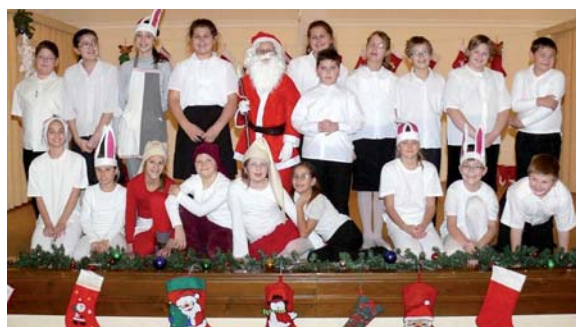
Remélem, nem csak az igazi Mikulás, hanem mi is nagy örömet és meglepetést szereztünk a gyerekeknek és mindenkinek, akik látták műsorunkat.”

Műsorunk végére megérkezett az igazi Mikulás is, aki minden kisgyereket megajándékozott egy-egy csomaggal, furulyázott és még énekelt is nekünk. Mivel akkor hó nem esett, egy lovaskocsi vitte tovább őt a többi kisgyermekhez a műsor végén.