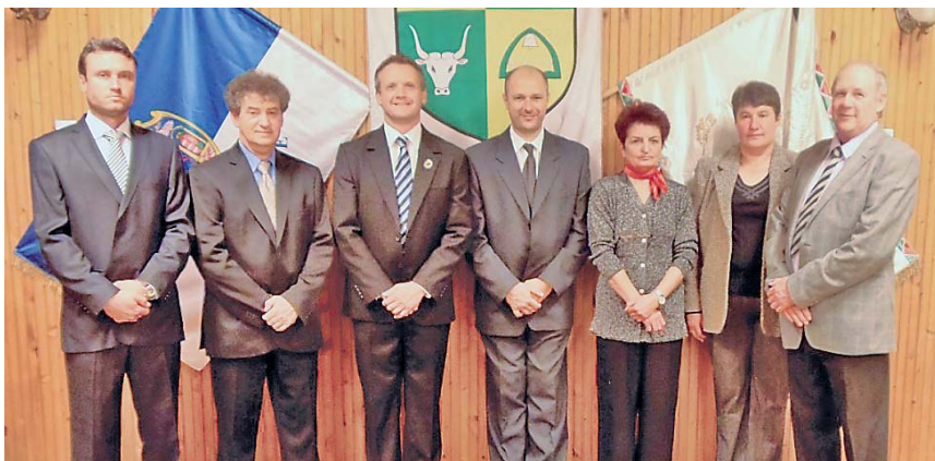
Az új testület 2014. október 21-én tartotta alakuló testületi ülését