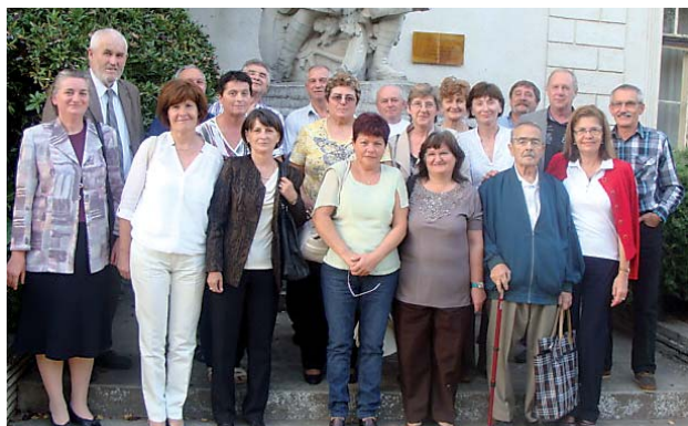
45. éves találkozóját tartotta az 1969-ben végzett 8. osztály