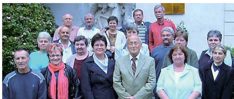
40. éves találkozóját tartotta az 1974-ben végzett 8.A és 8.B osztály