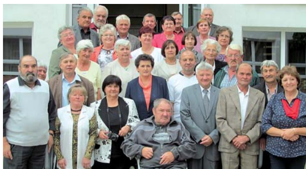
50. éves találkozóját tartotta az 1964-ben végzett 8.A és 8.B osztály