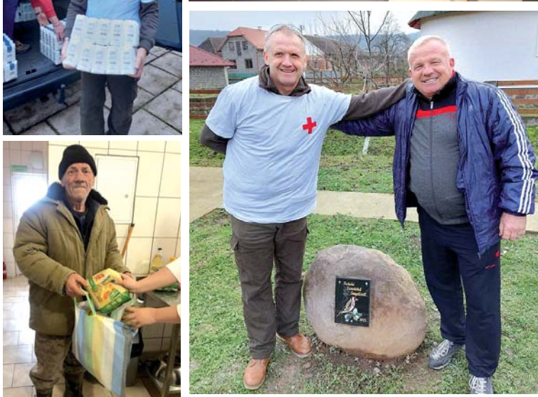
2022-ben a Bethlen G. alapítvány által támogatott emlékhely kialakítása