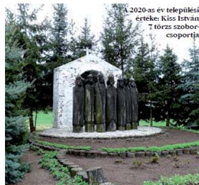
A 2020-as év települési értéke: Kiss István 7 törzs szoborcsoportja