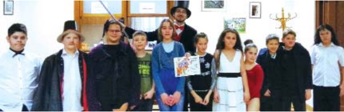
Vitathatatlan, hogy a legnagyobb showmanek a negyedikben vannak. A világ-hírű filmmusical a faluház színpadán is nagy sikert aratott