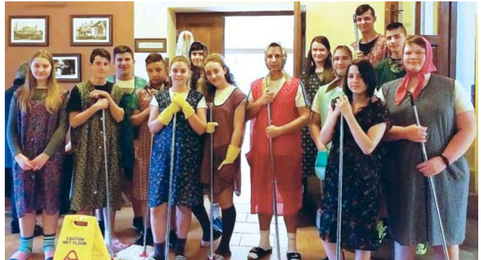
A jövőben nem lesz hiányszakma idehaza. Ez a nyolcadikos vállalkozás például jól működik. A titok, hogy a csak nőket alkalmazó cégben mindenki táncolva, zenére takaríthat.