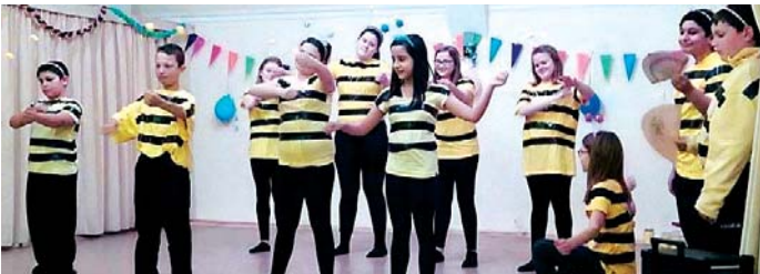
Az ötödikes kaptárban szorgos méhecskék gyűjtik és vigyázzák a mézet

A bemutatókat követően valamennyi osztály egy-egy „fakanas” gigapizzát fogyasztott el. Az elmaradhatatlan tombolasorsolás, a szülők, nagyszülők, hozzátartozók által felajánlott házi sütemények, a szendvicsek és üdítők fogyasztása után kimerülve, táncra már csak kevesek perdültek. Diákönkormányzatunk ezúton is köszöni valamennyi támogatóknak, a szü-