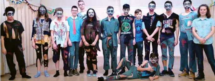
A közönség napokig nem aludt a hetedikes horrort látva. Nem csoda, hogy a felsős díjat a zombik kaparintották meg

jutalma egy-egy vándorserleg lett. Eredménytől függetlenül a legnagyobb győzelemnek azt tartjuk, ha az osztályok saját maguk és mások szórakoztatására a közönség tapsára méltó produkciót varázsolnak a színpadra, melyben együtt kóstolhatják a siker ízét. Kijelenthetjük, hogy élményből az idén sem volt hiány.