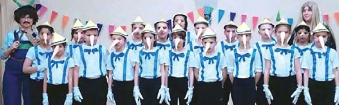
A varázspálca csodát tett: mindenki Pinokkióvá változott a 2.-3. osztályban