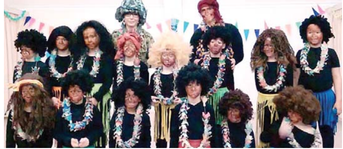
Az alsós győztesnek járó kupát az elsős emberevő benszülöttek kapták. Még szerencse, hogy a műsor előtt ebédeltek, így a foglyul ejtett vadász életben maradt