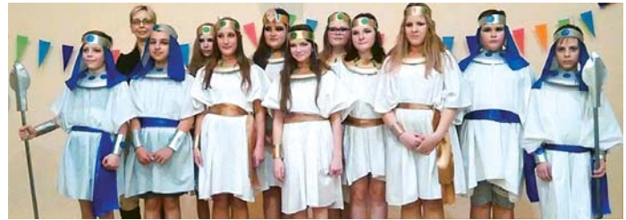
Egyiptomiak Tengelicen? Farsangkor még ez is lehetséges. Kleopátra is megirigyelte volna a hatodikosokat, ha láthatja a műsorukat