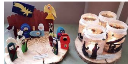
Alkotásaikkal 3. helyezést értek el és különdíj elismerésben is részesültek a 4. osztály tanulói