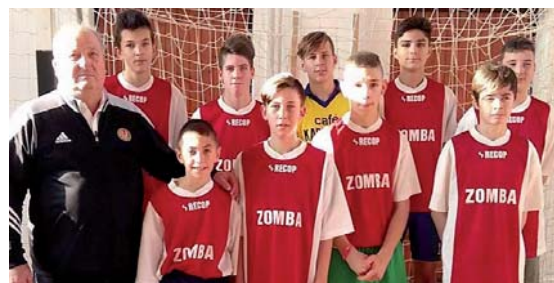
A győztes zombai csapat

A meghívásos torna rendszeres résztvevői a hazaiak mellett a környékbeli iskolák, Kölesd, Szedres és Zomba csapata.