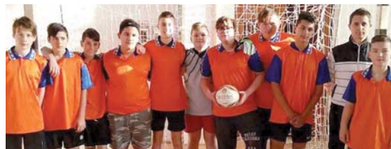
Tengelic harmadik helyezett lett