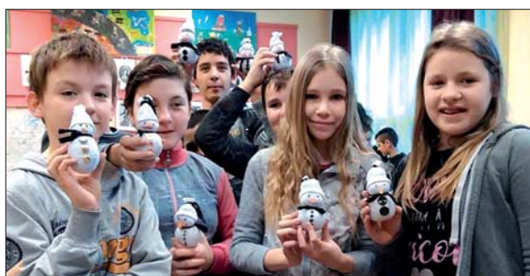
A hagyományos játszóházban kicsi és nagy egyaránt készíthetett a szeretteinek ajándékot.