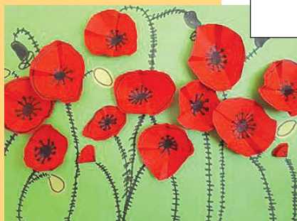
Kácsor Emília alkotása

Vihar, ha orvul mennydörög: kugliznak fenn az ördögök, fűrgé felhő száll, dús-esős, lenn fű között időz az őz, hisz' messzi még az ősz, a csősz.