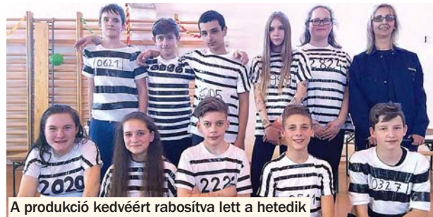
A produkció kedvéért rabosítva lett a hetedik

A zsűri döntése értelmében az alsós osztályok közül az elsősök, a felső tagozatosoknál a nyolcadik osztály nyerte a legjobb produkcióért járó vándoroszerleget. A legötletesebb jelmezért járó oklevelet pedig a másodikosok vehették át.