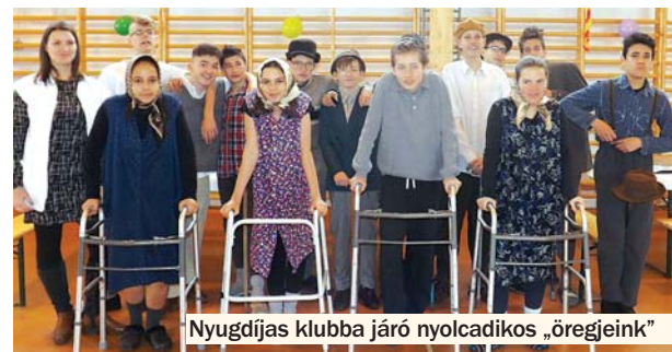
Nyugdíjas klubba járó nyolcadikos „öregjeink”