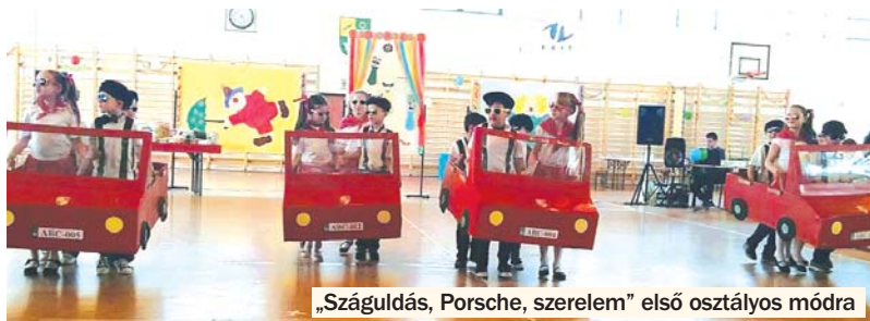
„Száguldás, Porsche, szerelem” első osztályos módra