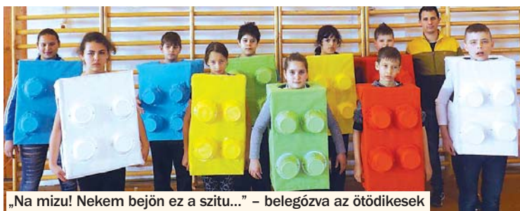
„Na mizu! Nekem bejön ez a situ...” - belegözve az ötödikesek