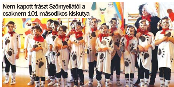
Nem kapott frászt Szörnyellátót a csaknem 101 másodikos kiskutyája