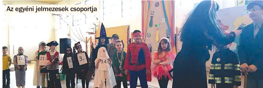
Az egyéni jelmezeselek csoportja