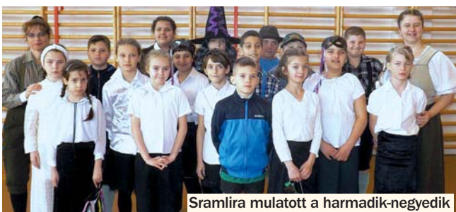
Sramlira mulatott a harmadik-negyedik